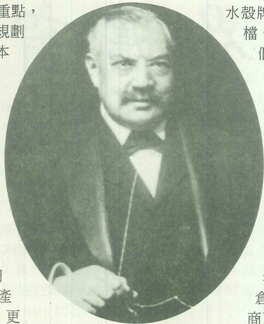
英國殼牌公司創立者Mascus Samuel

殼牌公司在台灣一百多年的發展，雖因政權更迭，外籍主事者替換頻繁；無法有系統將所有歷史資料復原，具體呈現出來，但是淡水文化基金會與台灣殼牌公司將以契而不懈的精神，逐步透過各種方式展開歷史資料搜集的工作，建立淡