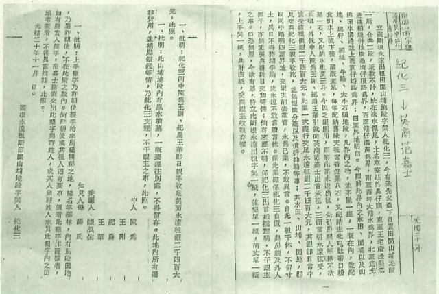
英商范嘉士洋行土地買賣契內容

殼牌倉庫史蹟園區在2001年6月起，一項小而美的殼牌集團相關圖像資料，將驚艷般展現百年世界大企業珍貴歷史容顏。