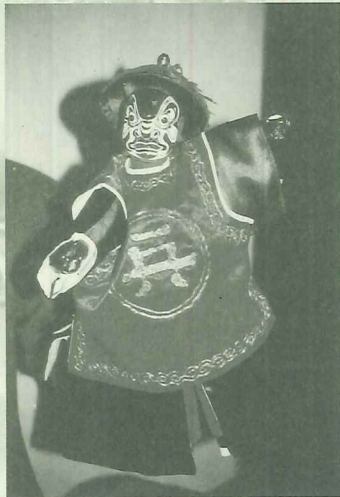
花臉造型的清朝兵勇戲偶